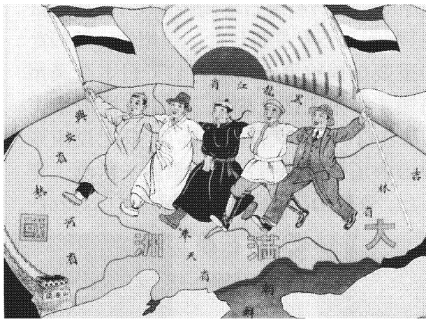
名古屋市博物館所蔵