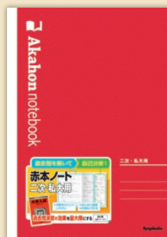
赤本ノート (二次・私大用)