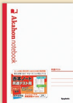
赤本ノート (共通テスト用)