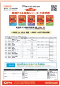
共通テスト赤本シリーズ ご注文書