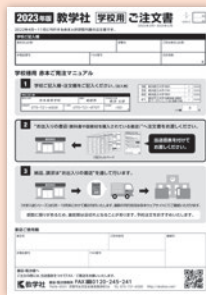
2023年版 教学社 学校用ご注文書