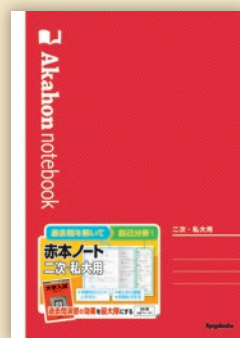
赤本ノート (二次・私大用)